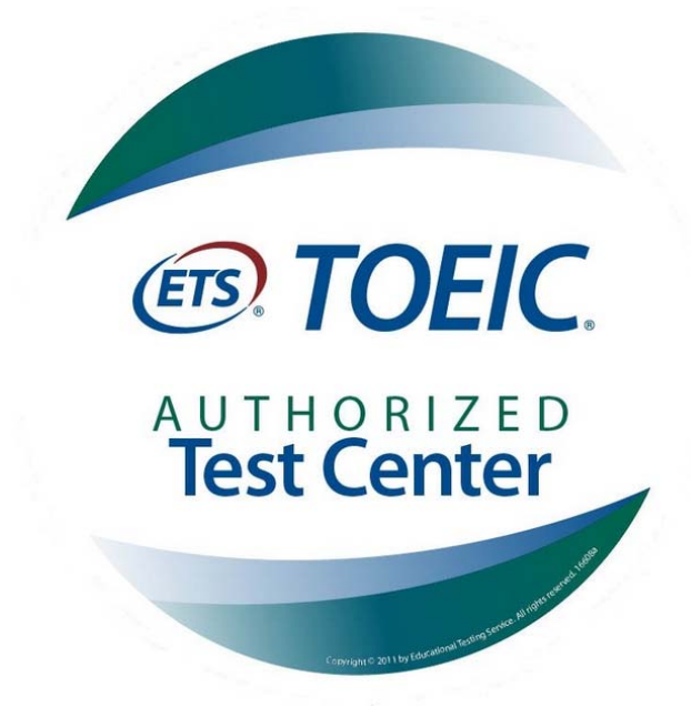
3. ábra: ETS – TOEIC nyelvvizsga központ logója

Jelenleg valamennyi iskolánkban szervezhetünk ennek égisze alatt nyelvvizsgákat, amelyek közül az angol nyelvű honosítható hazánkban.