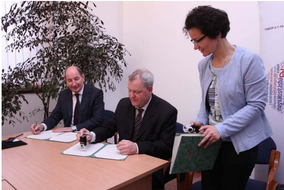
24. kép: Együttműködési megállapodás aláírása a Miskolci Egyetemmel

valamennyi érdeklődő intézménye irányában. Ezt alapoztuk meg 2016. január 7-én, amikor aláírtuk a Miskolci Egyetem képviselőivel az együttműködési megállapodásunkat.