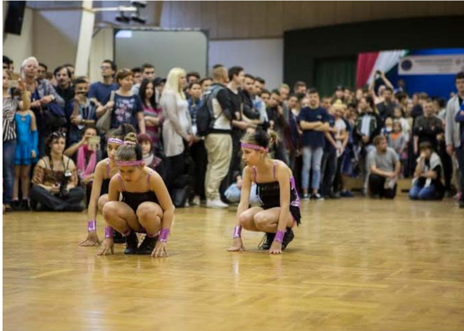
28. kép: Szakmák Éjszakája – Weiss iskola

A rendezvényt a nagy sikerre való tekintettel jövőre is szeretnénk megrendezni.