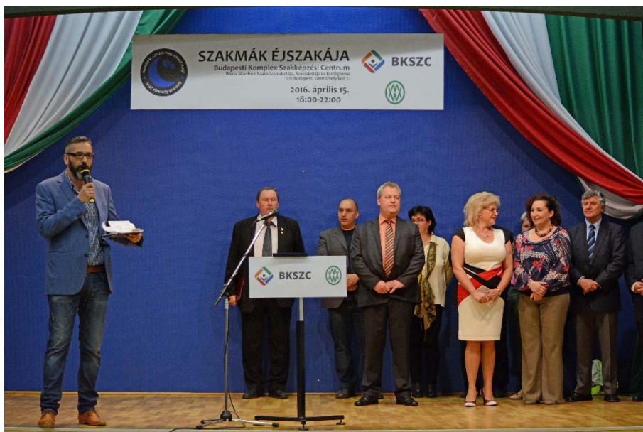
26. kép: Szakmák Éjszakája – Weiss iskola