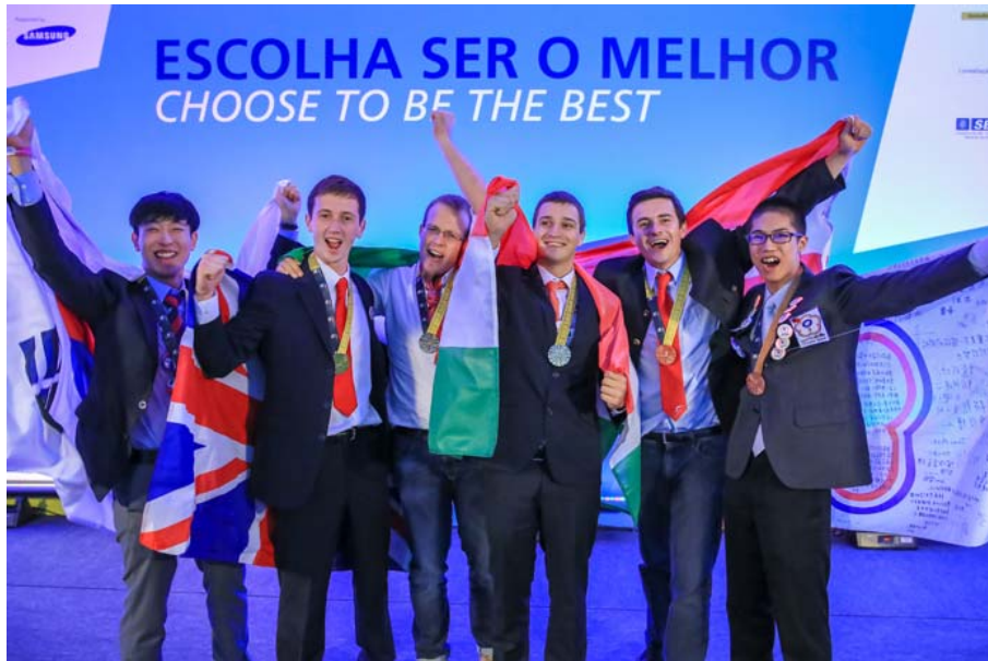
30. kép: Worldskills 2015 Sao Paulo – győztes csapat

Tehetséggondozás, és versenyre való felkészítés nem tud működni a megfelelő infrastruktúra, eszközrendszer nélkül. Éppen ezért komoly – több 10 millió forintos - tanműhely fejlesztést végeztünk az alábbi iskoláinkban: