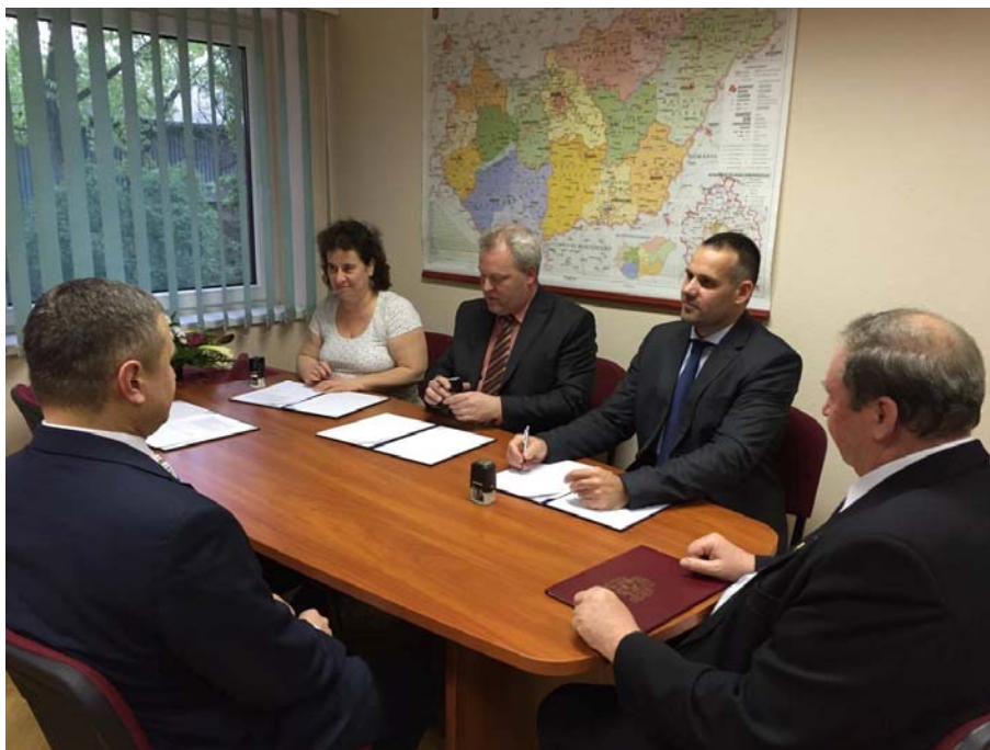
29. kép: Együttműködési megállapodás aláírása (NOE, SZGYF)