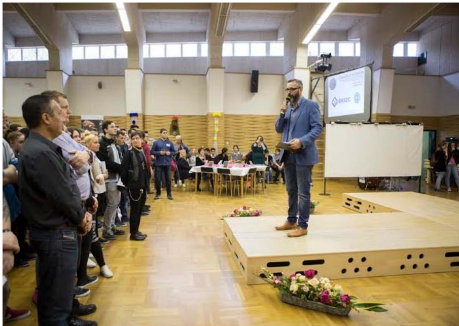
25. kép: Szakmák Éjszakája – Weiss iskola

A többi iskolánk a másik két helyszínünkön vett részt programokban. Összességében elmondható, hogy több mint 550 programmal, több mint 650 pedagógus bevonásával, több mint 3000 látogató fogadásával igencsak komoly rendezvényt tartottunk.