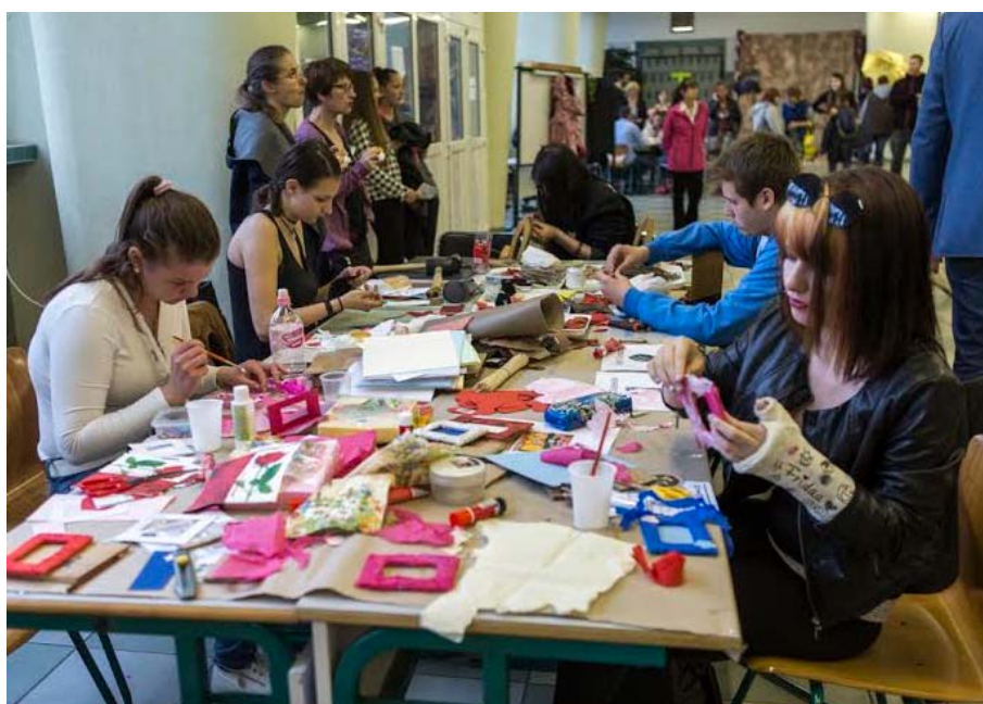
27. kép: Szakmák Éjszakája – Weiss iskola